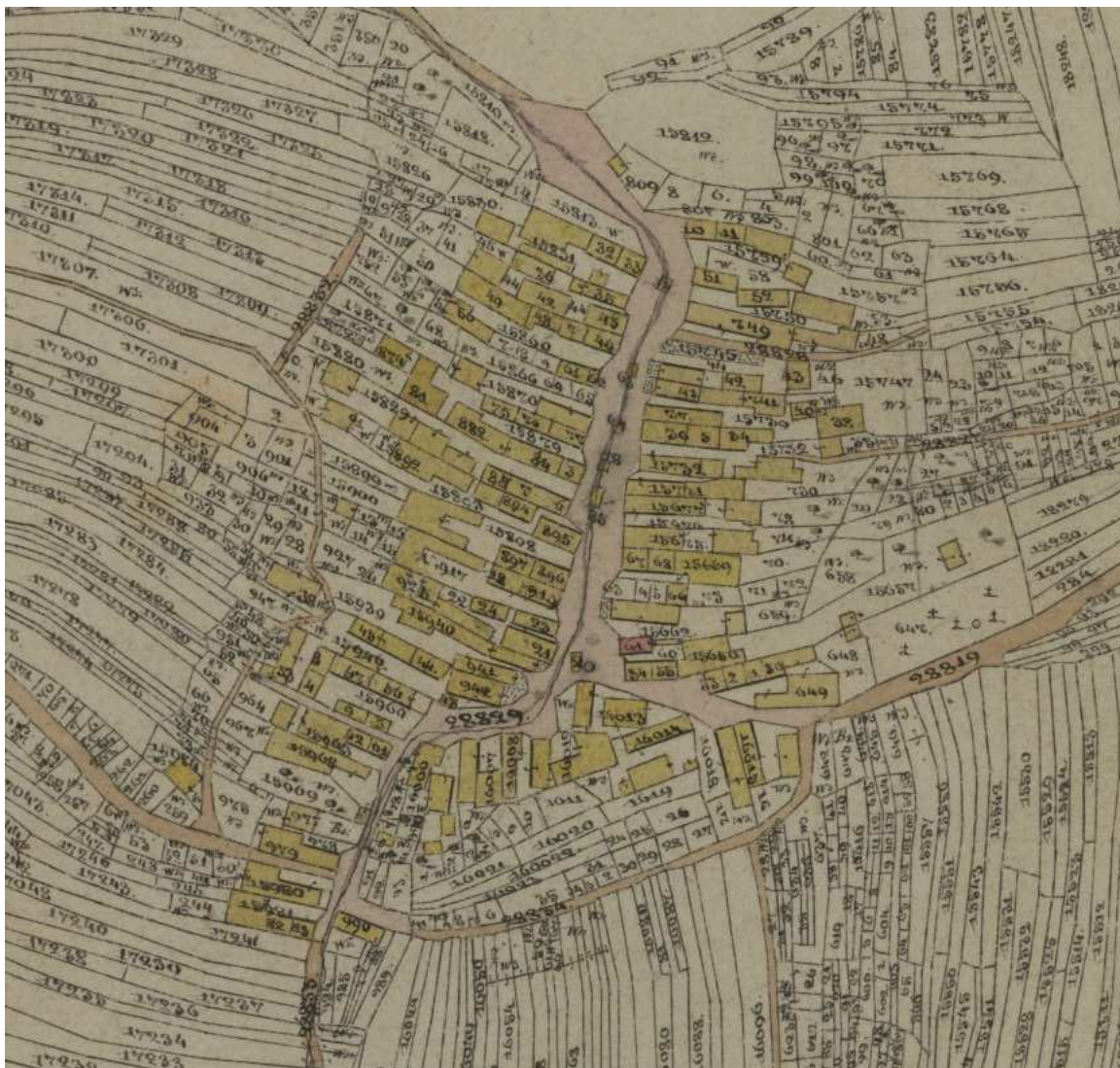
výrez z historickej katastrálnej mapy z roku 1860