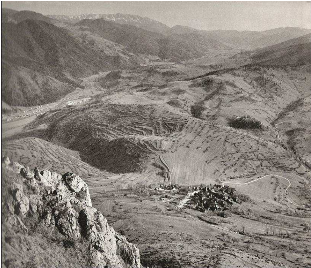
Pohľad na situovanie sídla Vlkolíneec z masívu Sidorova v minulosti a dnes