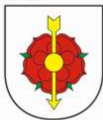
a/ erb mesta