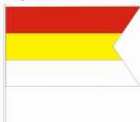
b/ vlajka mesta