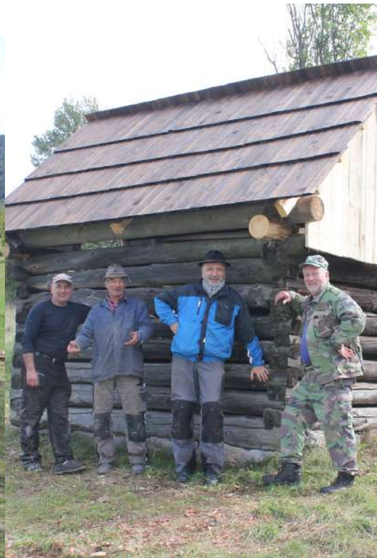
Nové odoskovanie štítov strechy vrátane osadenia typických výklopných dverí