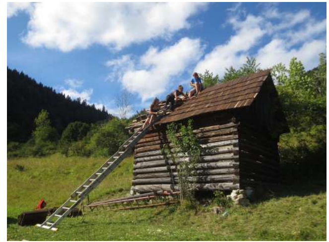
Prešindľovanie južnej strany strechy senníka