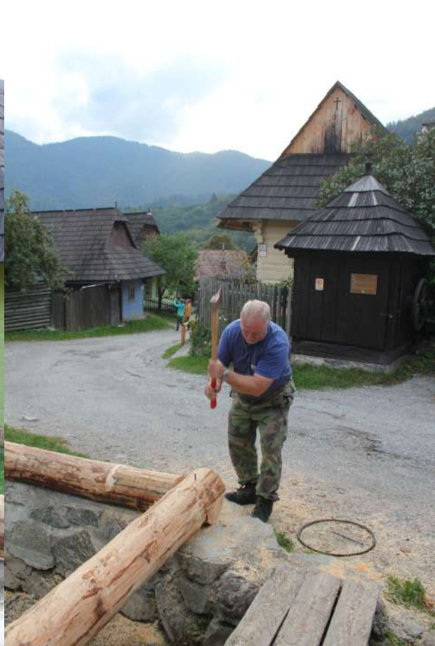
Výmena drevenej obruby požiarnej nádrže