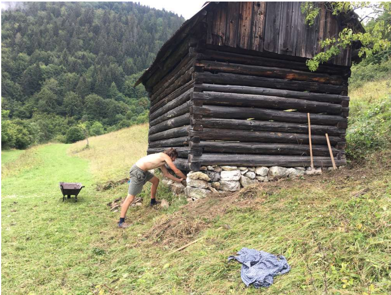
Oprava podmurovky senníka na „Záhumniskách“