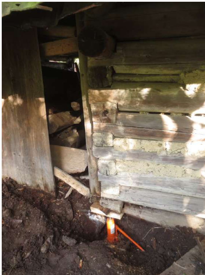
Odhnité časti trámov sa museli odstrániť