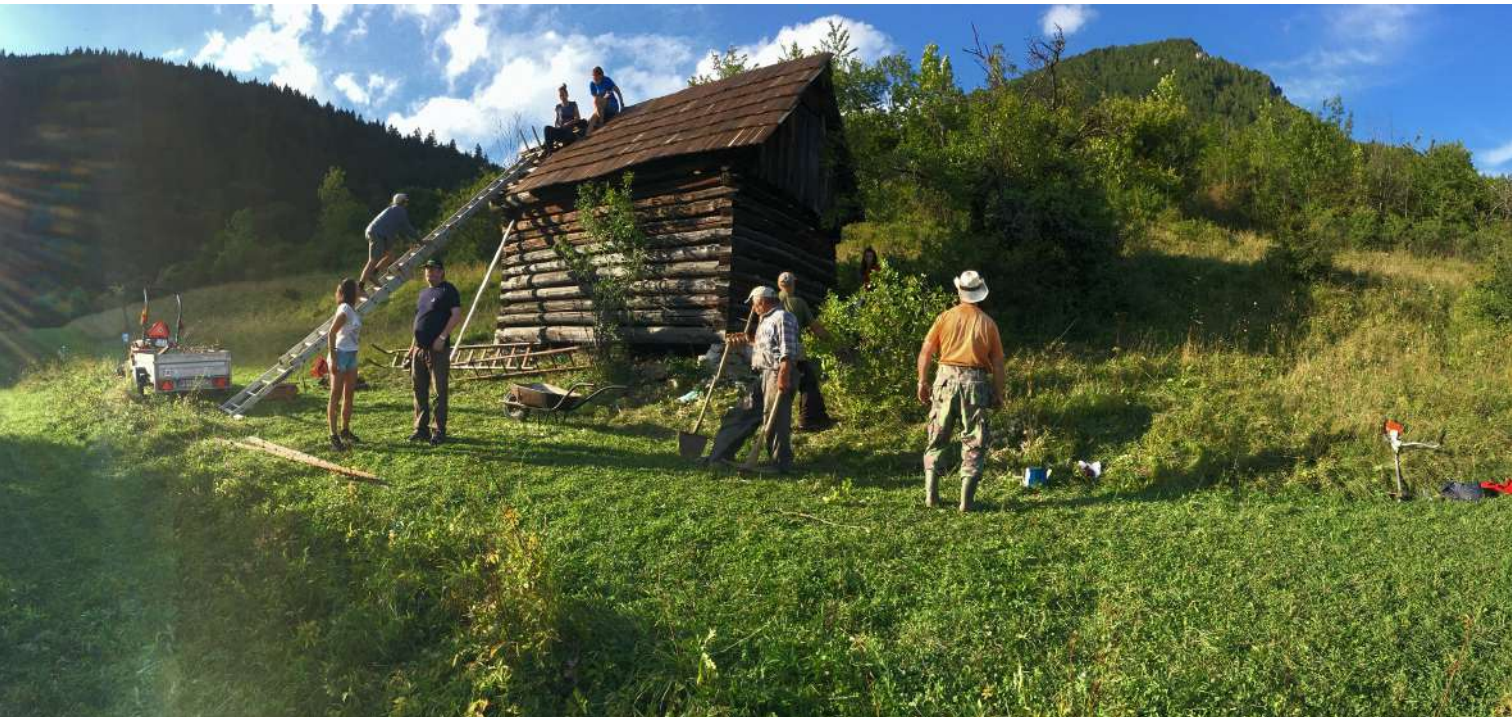
Údržba senníka na „Záhumniskách“. Okrem šindľovania aj obkopenie a vykosenie náletových drevín