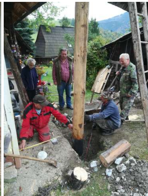
Celková oprava vstupnej brány do domu v dedine