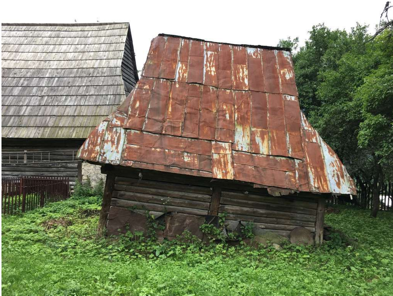
Havarijný stav nakláňajúceho sa humna