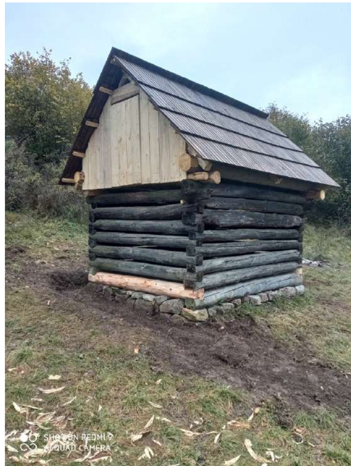
Pohľad na opravený senník „Pod Strážou“