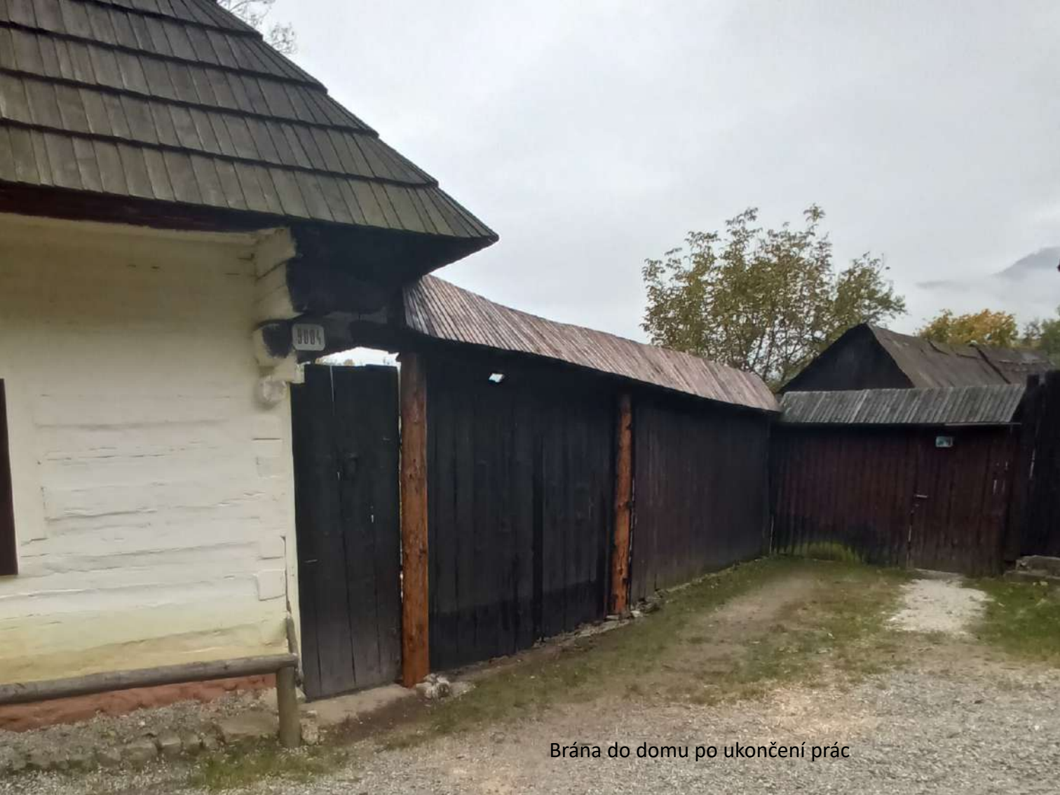
Brána do domu po ukončení prác