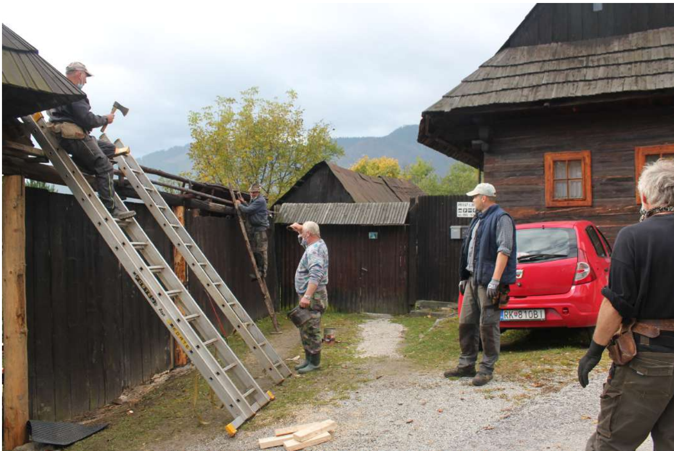
Šindľovanie striešky brány a plotu