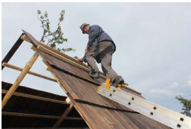
Workshop Vlkolínec 2020