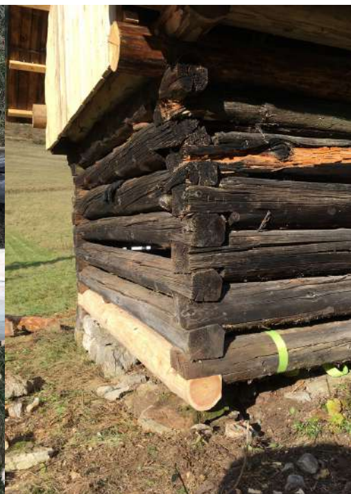
Vymieňanie odhnitých spodných brvien