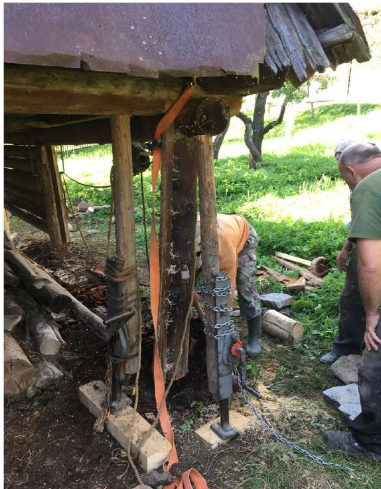
Vyberanie odhnitého trámu zrubovej časti a oprava stien prednej stĺpikovej časti