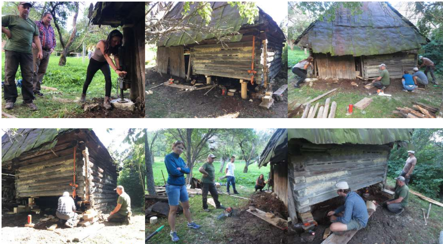
Postupné dvíhanie humna pomocou hydraulických a mechanických heverov