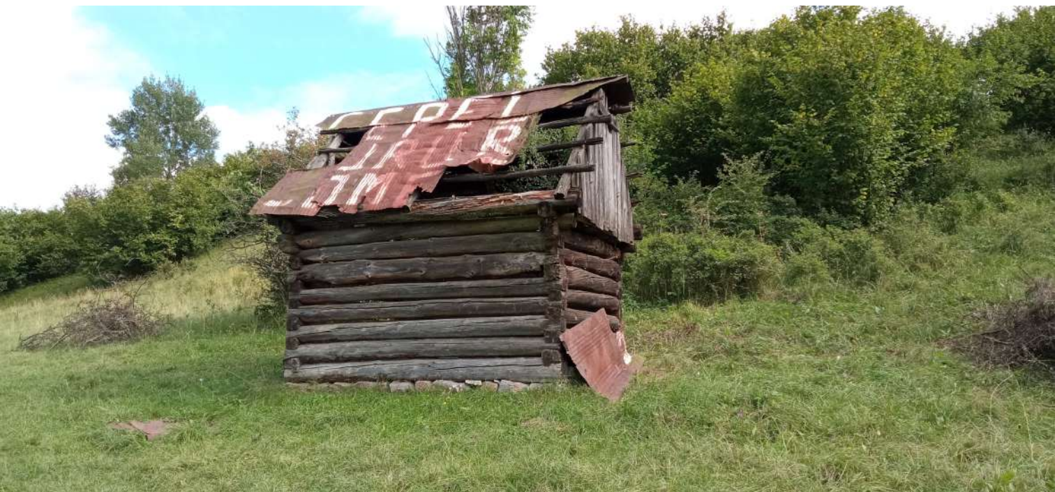
Stav senníka v časti „Pod Strážou“ pred opravou