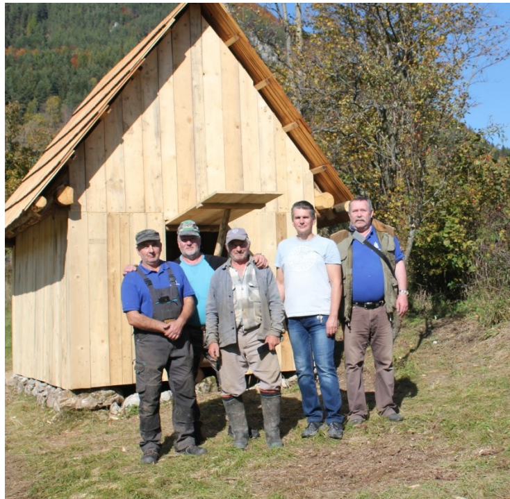
Účastníci Workshopu Vlkolíneč 2022 pred obnoveným senníkom.