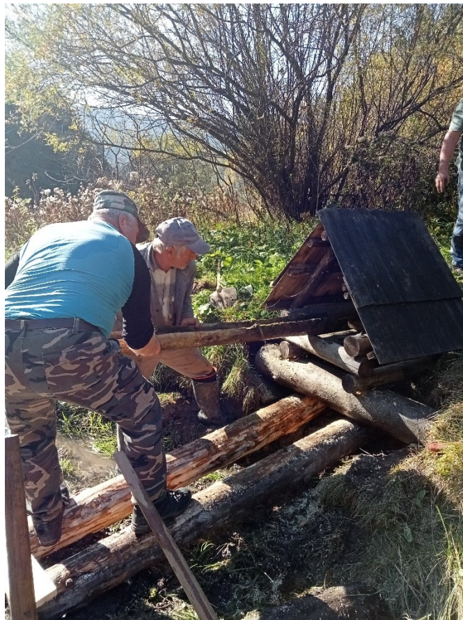
Oprava a výmena prístupu k studničkám v lokalite Vlkolíneč I.