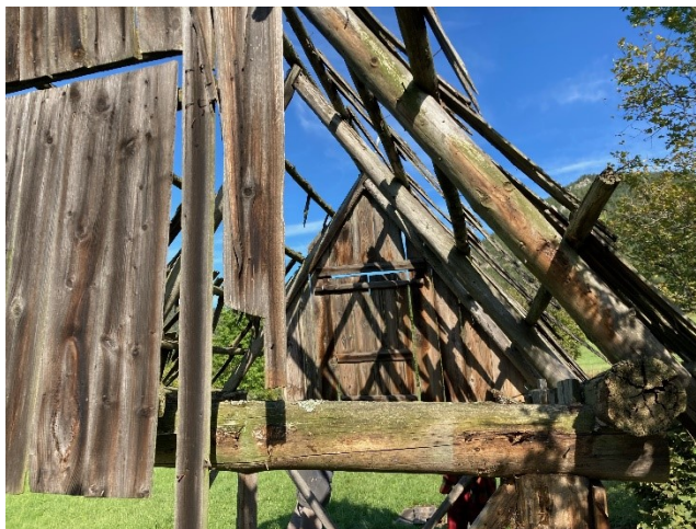
Demontáž objektu senníka, poškozených, odhnitých a zvetraných částí.