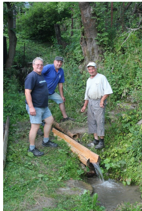
Vydlabávanie, prenášanie a osadenie žľabu v potoku.