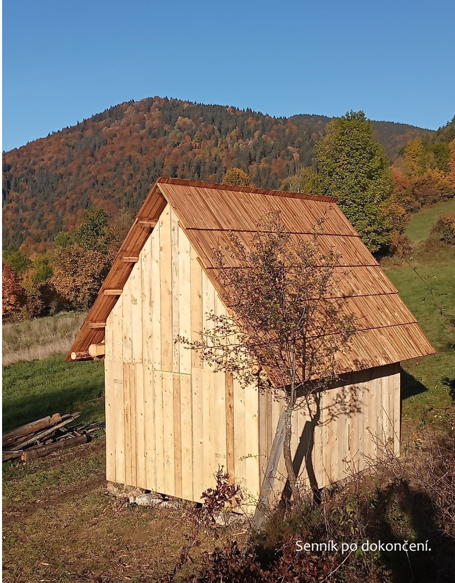
Senník po dokončení.