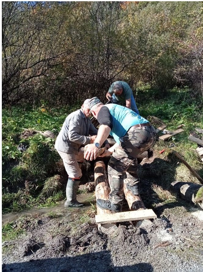
Oprava a výmena žľabov v studničkách v lokalite Vlkolíneec.