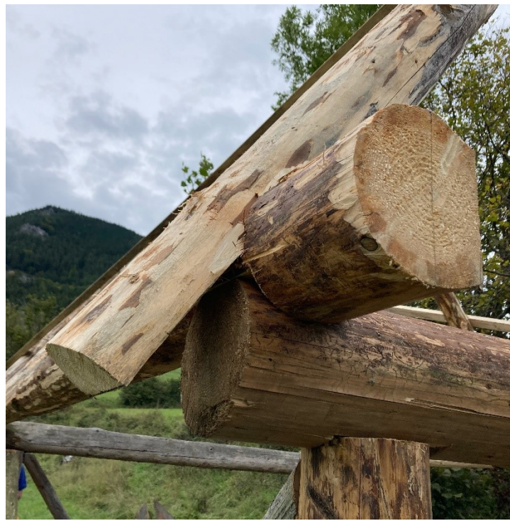
Detaily tesárskych spojov II.