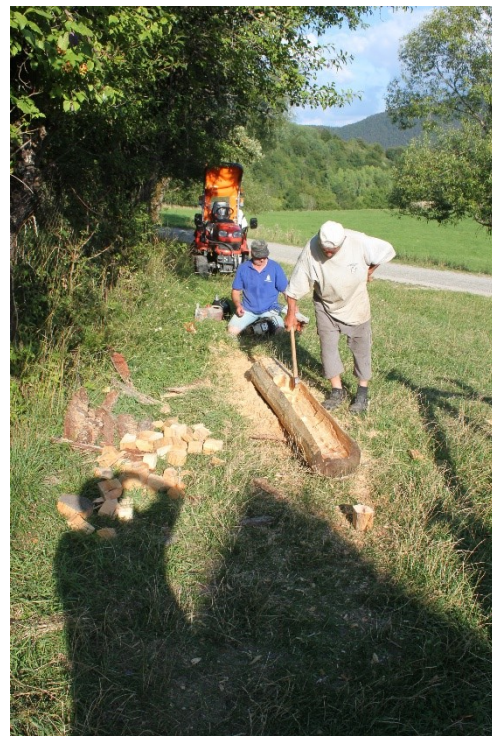
Čistenie potoka, odkôrovanie a vydlabávanie žľabu.