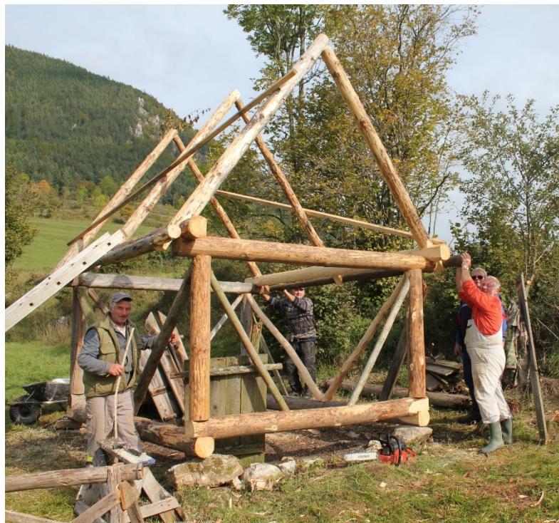
Realizácia strešnej drevenej konštrukcie – osadenie pomúrníc a krokiev.