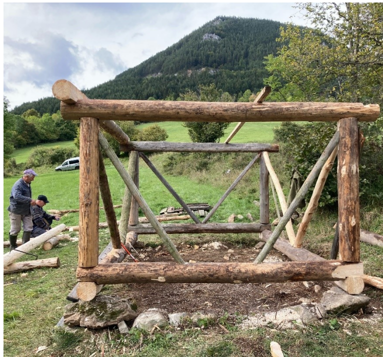
Výstavba novej nosnej konštrukcie objektu senníka II.