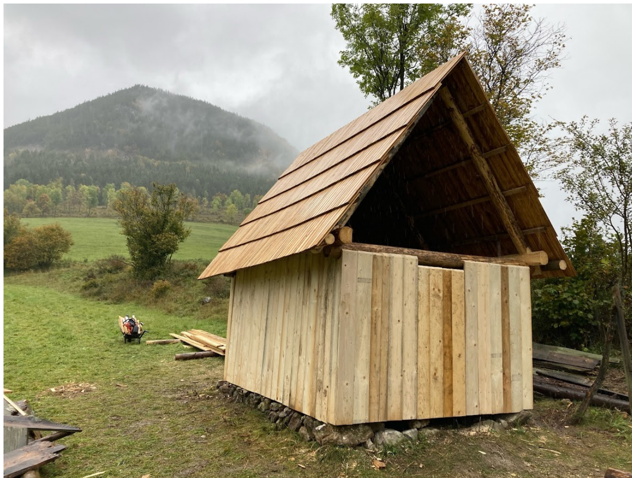
Senník pred obitím čelnej strešnej časti.