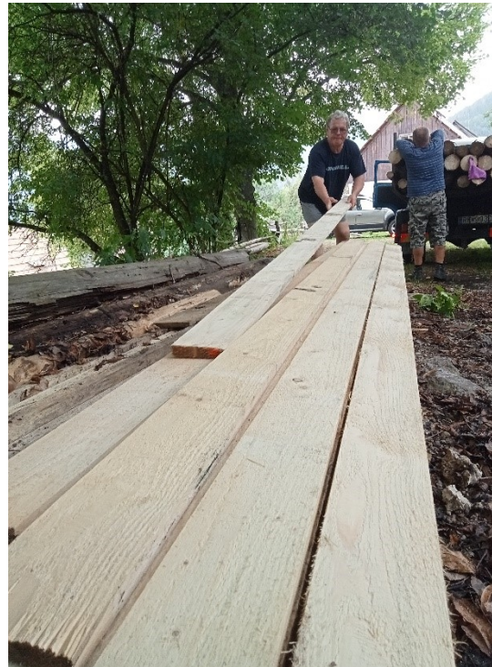
Prípravné práce - dovoz a manipulácia s rezivom a guľatinou.