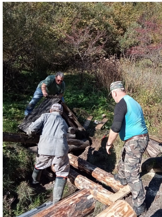
Oprava a výmena prístupu k studničkám v lokalite Vlkolínec II.