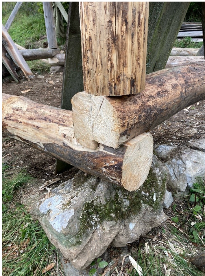
Detaily tesárskych spojov I.