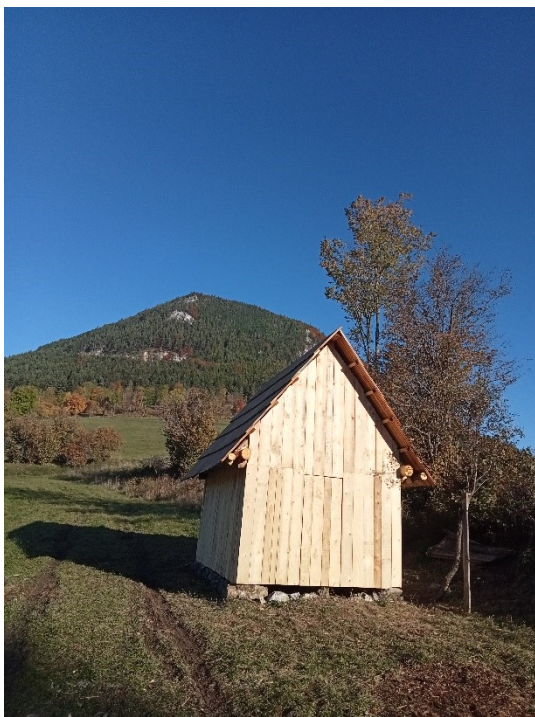
Workshop Vlkolíneč 2022