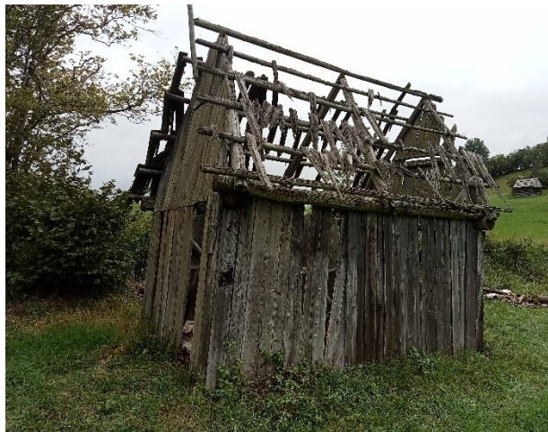
Senník. Stav pred rekonštrukciou v auguste 2022, objekt slúžil pôvodne na skladovanie sena.