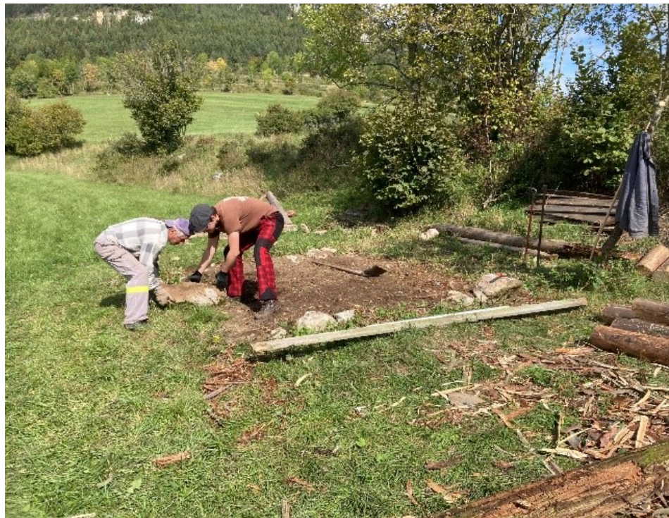
Úprava terénu pod nový objekt senníka, realizácia kamenného vyvýšeného podkladu.