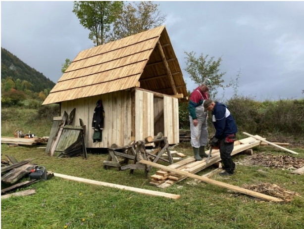
Obíjanie objektu senníka drevenými hnanými nehobl'ovanými doskami.