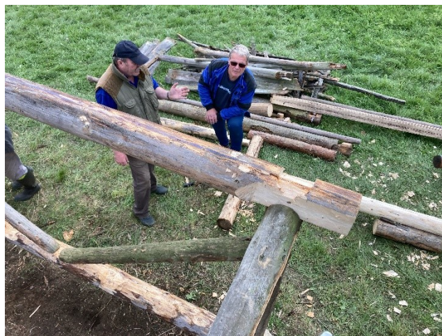
Výstavba novej nosnej koštruktie objektu senníka I.