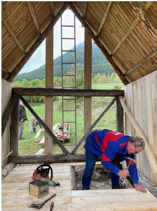
Realizácia drevenej podlahy z hranených nehobľovaných dosiek.