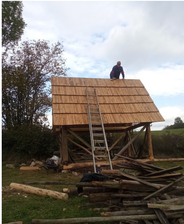
Kladenie šindľovej drevenej strešnej krytiny.