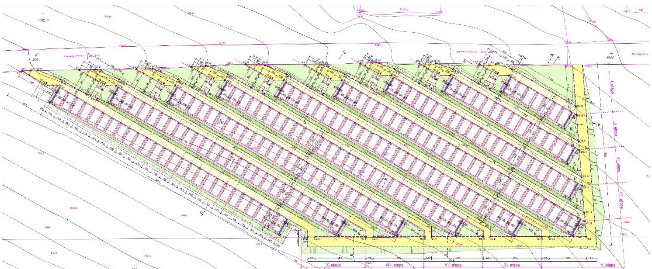
Obrázok 2 Pódorys – návrh hrobových miest