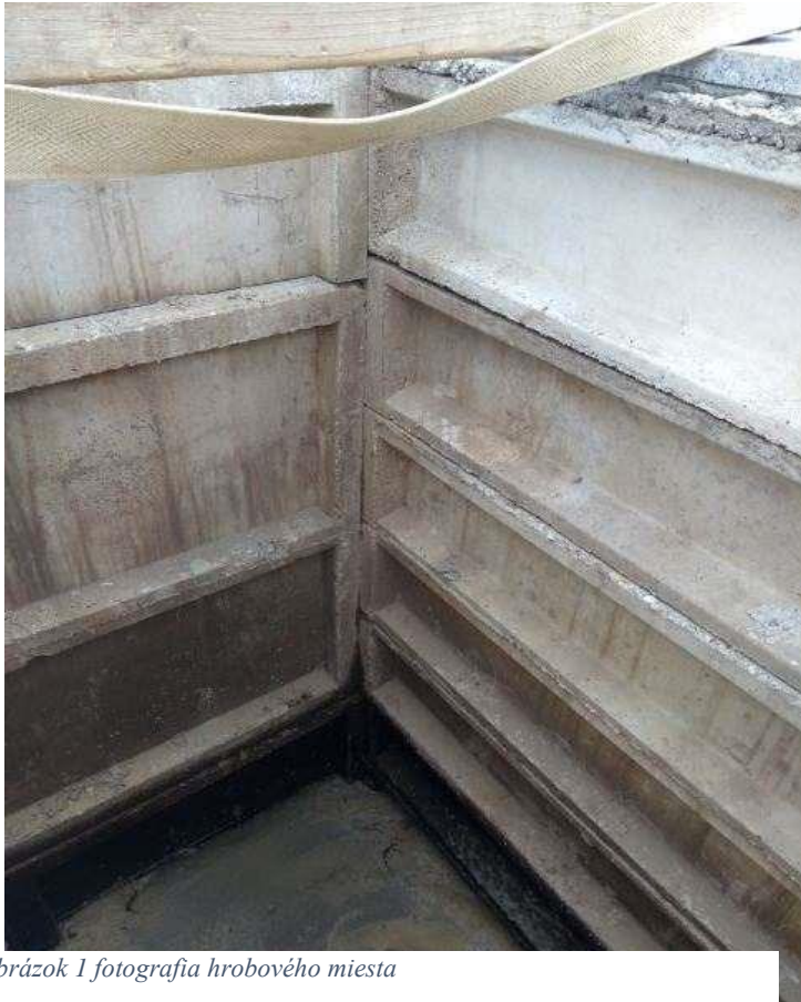
Obrázok 1 fotografia hrobového miesta

Vysúťažená cena z VO je 80 850 €, ZoD je podpísaná a začíname z realizáciou diela.