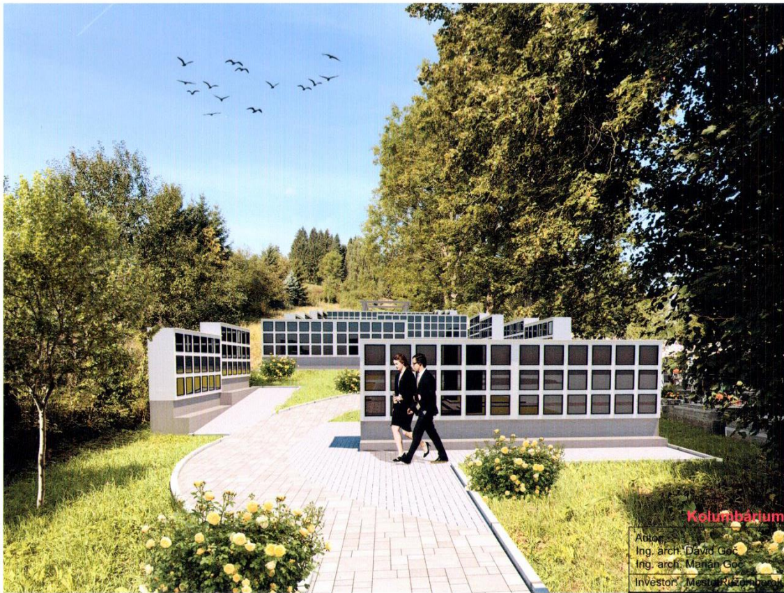
Kolumbárium alt A

Atelier Ing. arch. David Gábor Ing. arch. Marián Gábor Investor: Mesto Ružomberok ARCHITEKTONICKÝ ATELIER GAM Nám. A. Hlinku 27, Ružomberok http://www.gam.frage.sk