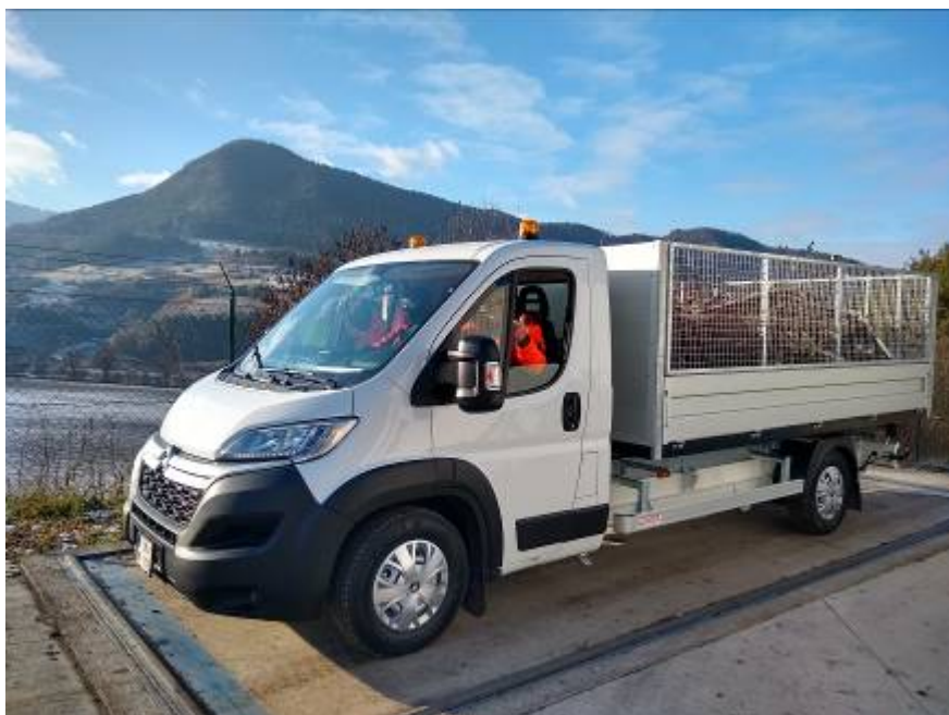
Dovoz BRO – nové vozidlo - valník