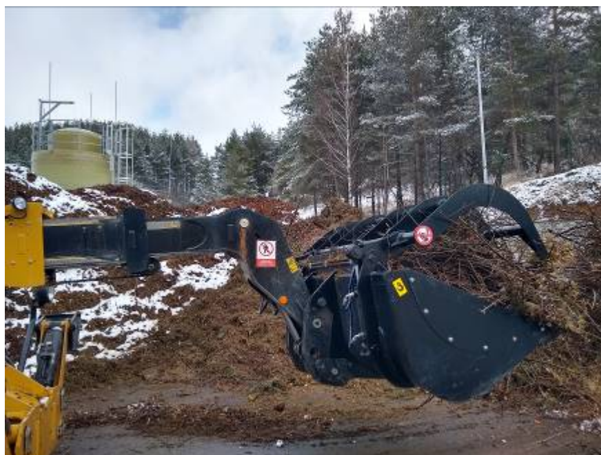
Manipulácia s konármi – nová lopata s pridžiavačom