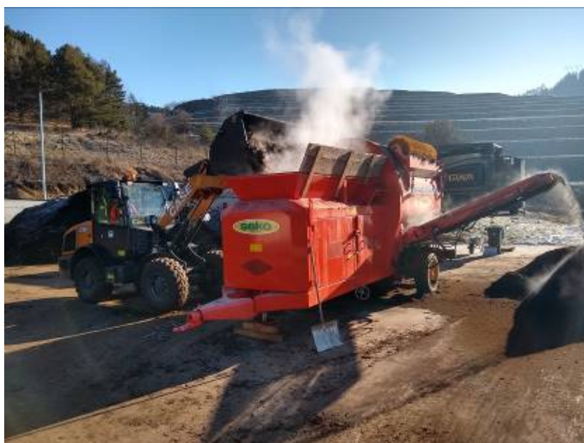
Triedenie kompostu – Separátor