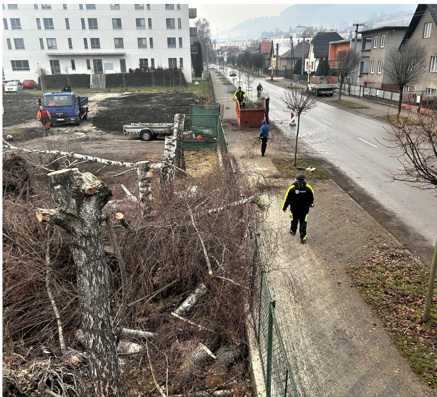
Práce pri výrube Plavisko Odstraňovanie drevín Baničné