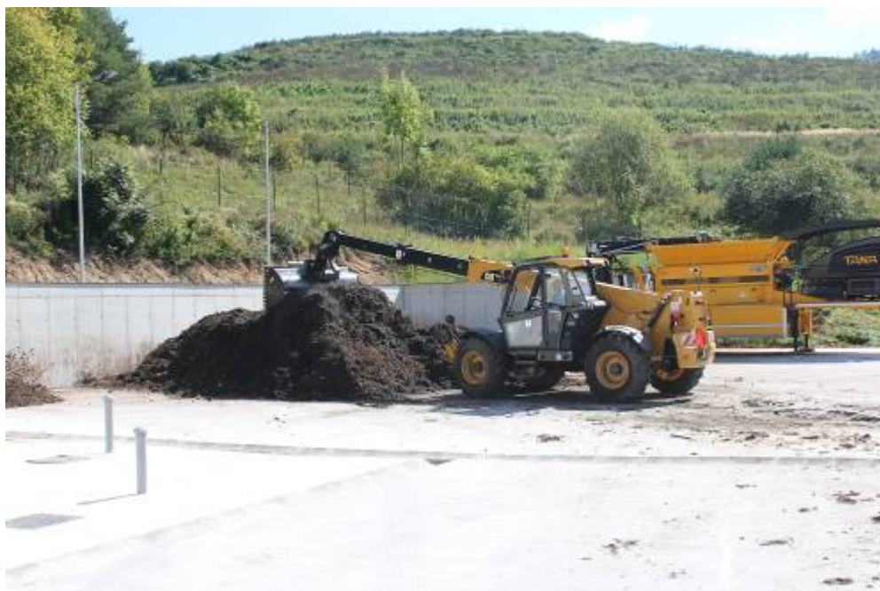
Zmiešavanie zložiek BRO – drť z konárov, tráva