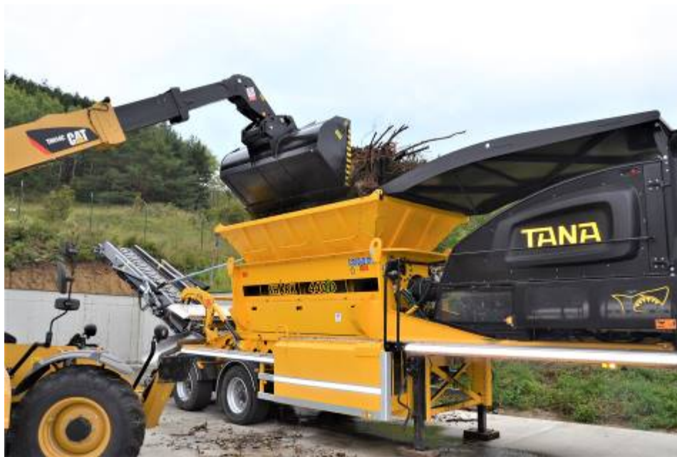
Drvenie konárov v drviči TANA