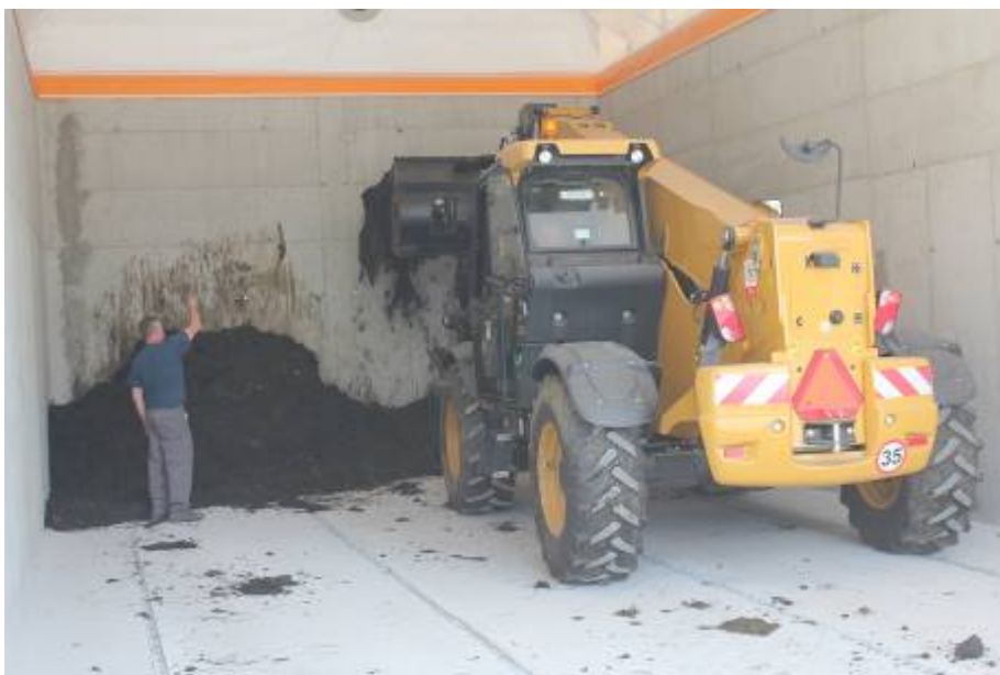
Nakladanie do kompostovacieho kontajnera